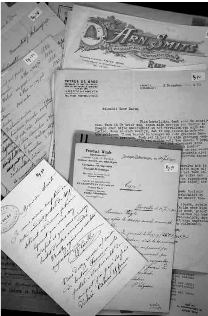
Collage archiefstukken Smits | Foto: Bart Jaski

participeren. 16 Deze gemeenschap heeft leden uit Australië, Duitsland, Finland, Frankrijk, Groot-Brittannië, Nederland, Litouwen, Mexico, Noorwegen, Oostenrijk, Zweden, Zwitserland en de Verenigde Staten. De stichting doet haar werk belangeloos, maar is voor haar werkzaamheden afhankelijk van financiële giften van anderen. De familie Vente, W.J.M Peeters uit De Bilt en J. van Gemert uit Utrecht hebben het belang van het werk gehonoreerd door het schenken van geldbedragen. Daarnaast zijn er ook fondsen geworven, vooral voor het digitaliseren. Er zijn onder andere bedragen beschikbaar gesteld door het Prins Bernhard Fonds, het KF Hein Fonds en De VSB-bank.