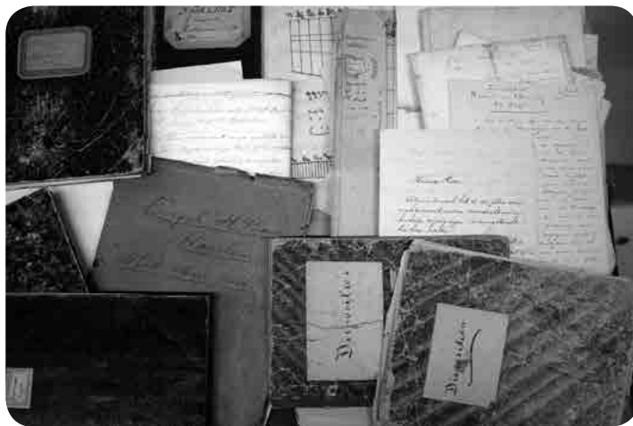
Collage stukken uit het archief Maarschalkerweerd